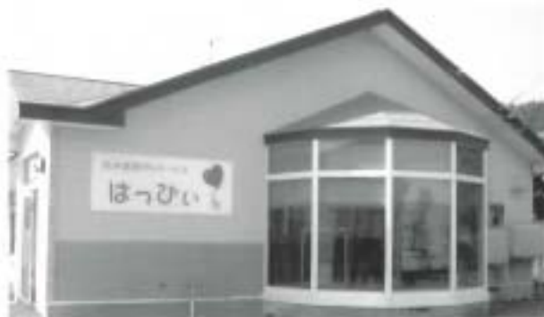
永井医院 デイサービス