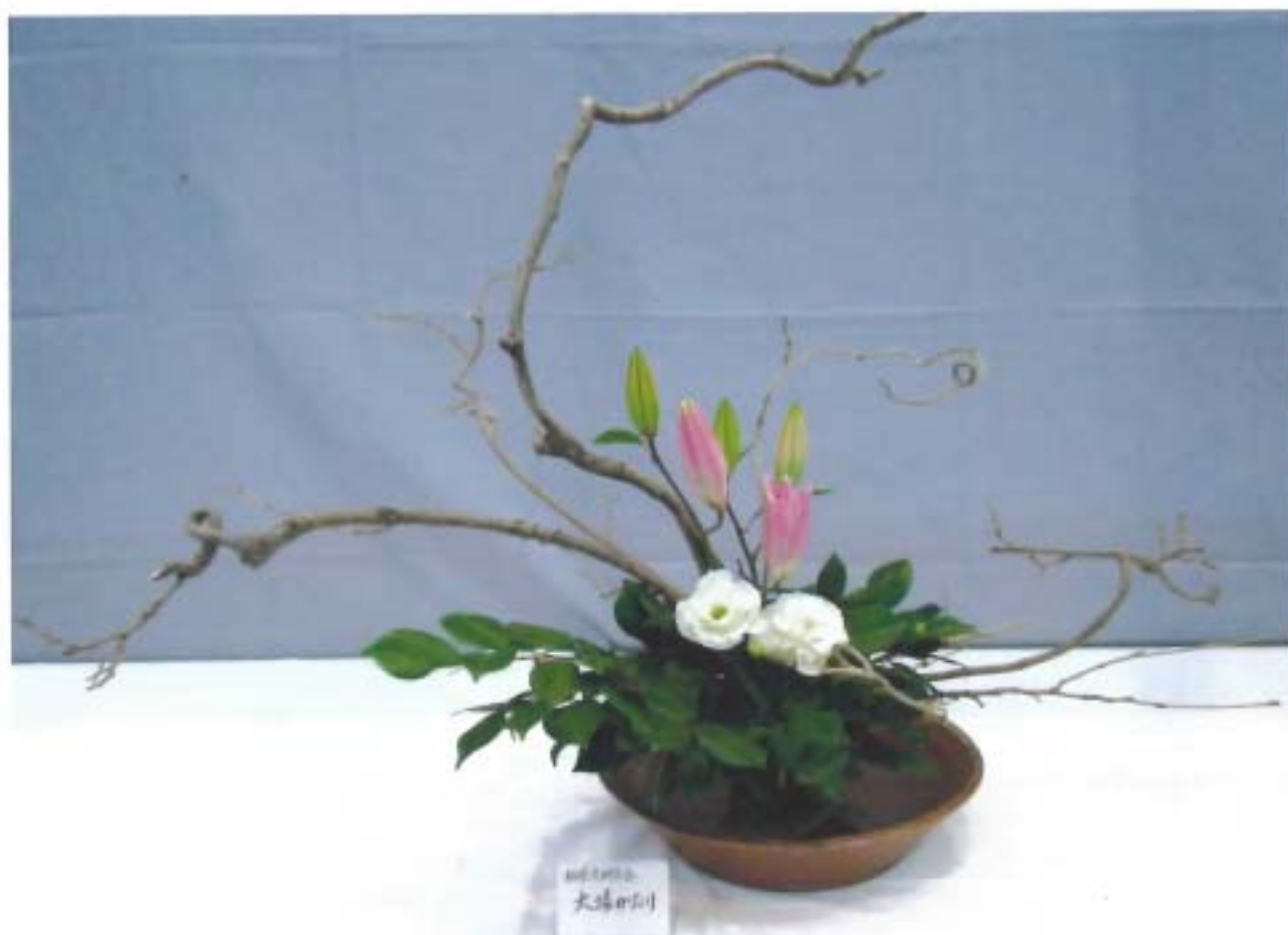
芸術文化祭に出展 栖霞流 大場草香（大場かおり）

発行/最上郡最上町向町536-9 内科：循環器科 医療法人 永井医院 TEL.0233-46-1511 http://www.nagai-clinic.or.jp