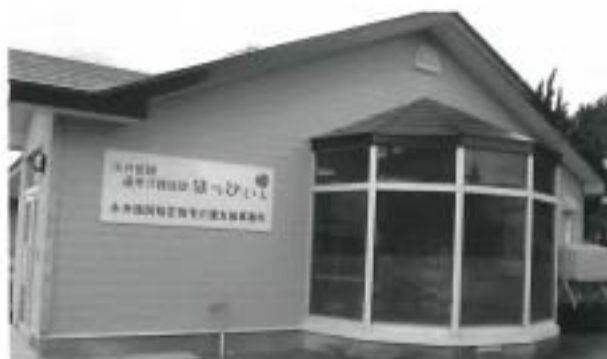
永井医院 デイサービス