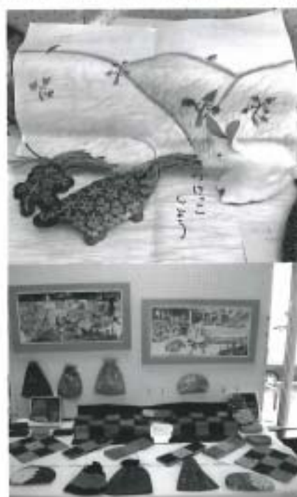
今回も力作が揃いました！

利用者の皆さんと職員が協力して赤や青、水色など様々な花ちり紙を一枚一枚手で丁寧に丸め、干支の絵に貼り付けていきました。完成まで約2か月かかりましたが、皆さん最後まで積極的に作製に参加してくださいました。地道な作業で大変でしたが、全てが完成し披露された時には利用者の皆さんと職員一同から喜びの声が上がりました。