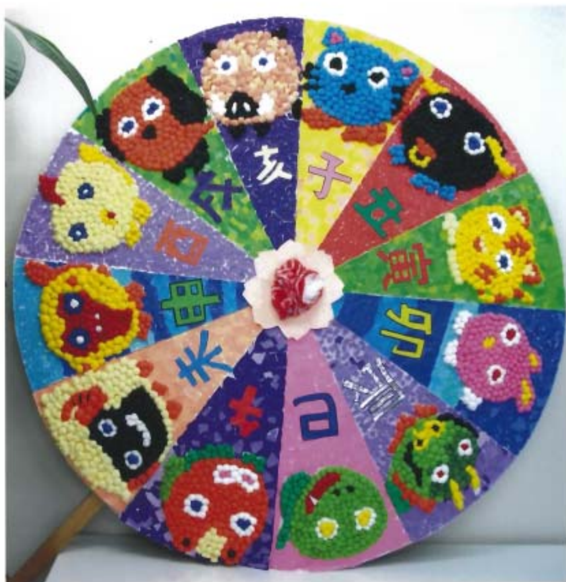
芸文祭出展作品（参照5ページ）

発行/最上郡最上町向町536-9 内科：循環器科 医療法人 永井医院 TEL.0233-46-1511 http://www.nagai-clinic.or.jp