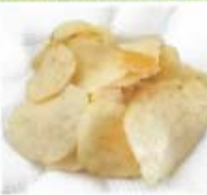
ポテトチップス1/4袋