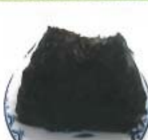
明太子のおにぎり1個