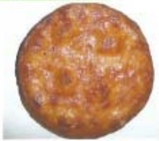
しょうゆせんべい1枚